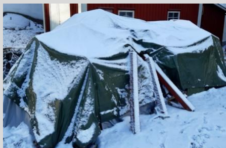
Under denna presenning väntar mängder med skolmöbler

Vi har fortfarande inte kunnat sluta samla på skolmöbler som annars skulle slängas(!). Vi har en mängd skolmöbler som ligger i en flyghangar, där vi fått låna utrymme, och väntar på transport. Och vi har lika mycket liggande på vår tomt! Men det saknas pengar. Har du möjlighet att bidra med liten eller (helst) stor summa, blir eleverna i Liberia mycket glada. Summa kostnad att skicka container till Liberia ligger på ca 70 000 kr.