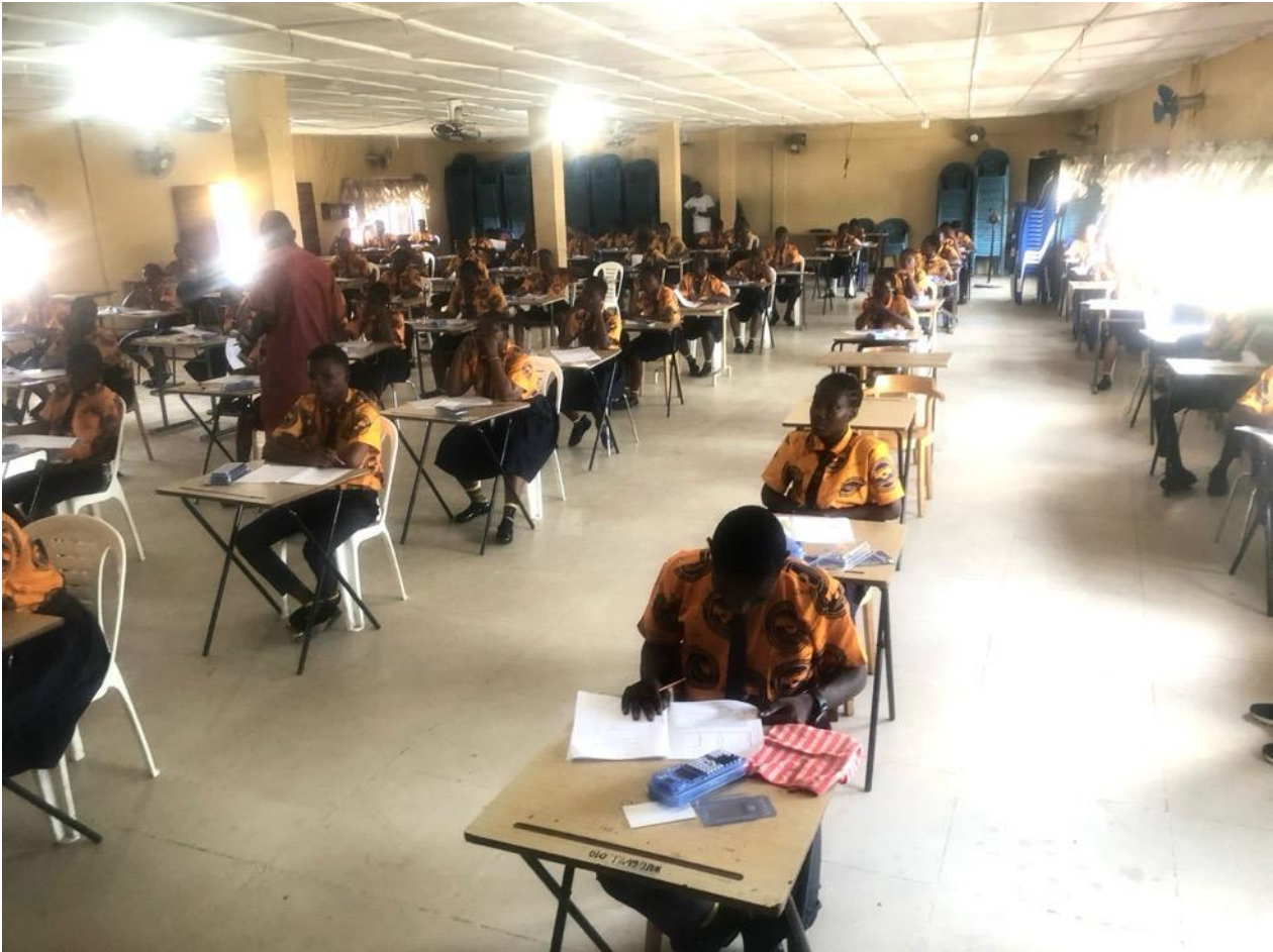
Examensprov i stora aulan.