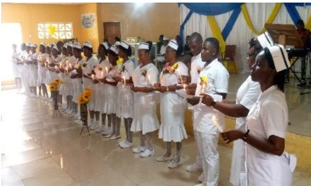
Oath and Honor Day program

Church Health Coordinator, Liberia Annual Conference.