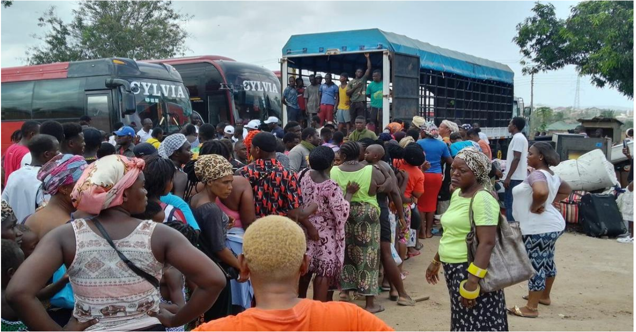
Liberianer som var flyktingar efter Liberias inbördeskrig 1989-2003 och blivit kvar i Ghana blir nu "avhysta" av Ghanas regering.