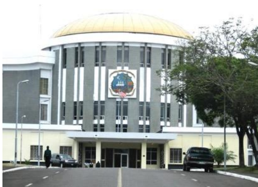
Houses of Parliament.

Budget: The President of Liberia Joseph Nyemah Boakai has signed into law the budget of Liberia for the year 2025 in the tone of the amount of $880m USD. According to the budget, priorities will be given to salary increment and to address critical national issues like roads and infrastructural development. Also, allocations are made for state owned enterprises, and key ministries, aiming to ensure the efficient operation of essential public institutions. According to the government, the move reflects the government's commitment to addressing pressing social and economic challenges while bolstering key sectors for national development.