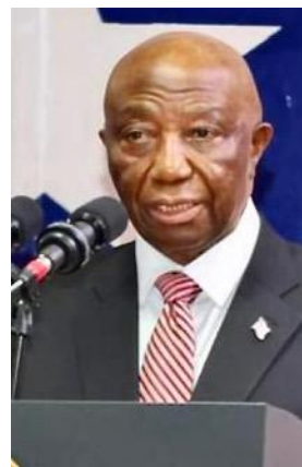
President of Liberia, Mr. Joseph Boakai