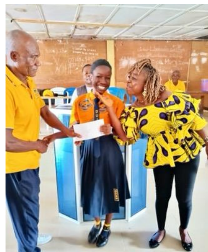
Någon från elevens familj är den som överlämnar hedersbetygelsen till respektive elev.

UTBILDNING är vägen till fred, frihet utveckling